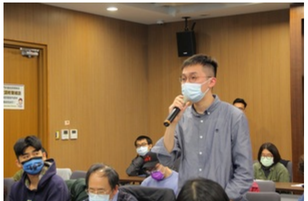
演講結束後聽眾提問與講者交流