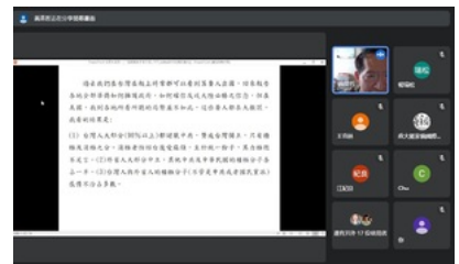
黃英哲談近代海外臺灣人的身分認同