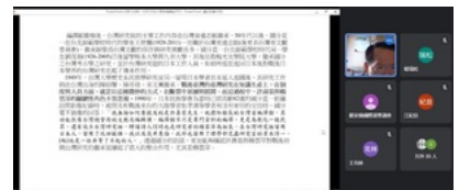
黃英哲論講戰後臺灣文化知識份子