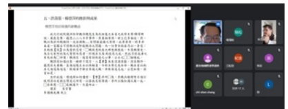
羅家倫國際漢學講座邀請客座教授黃英哲進行系列演講

在問答環節期間，線上觀眾踴躍發問，其中聽眾問道楊雲萍、許壽裳的合作關係，是中國認同？還是臺灣認同以及林獻堂(1881-1956)的漢詩創作心態諸問題。講者仔細回應，楊雲萍、許壽裳、林獻堂共通點是「漢民族意識」，其間楊雲萍的「延續明鄭」(1628-1683)，非繼承「中國」，而是特殊的開創性看法。