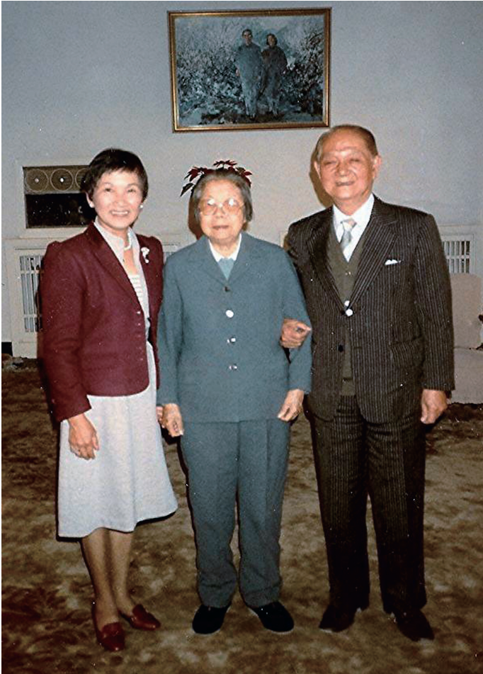
1984年11月楊基振夫婦與鄧穎超（中）合攝於中南海鄧宅。

本的大陸建設，從他留下的日記可以感覺到其對中國的熱情。甚至46年從中國倉皇返台後，依然相當關心中國，中國是1976年文革結束，1979年1月1日中國美國正式建交，歷史又邁入一個嶄新的段落。中國在同一時間以人代會常務委員會名義發表「告台灣同胞書」，對台溫情喊話。1981年「中華全國